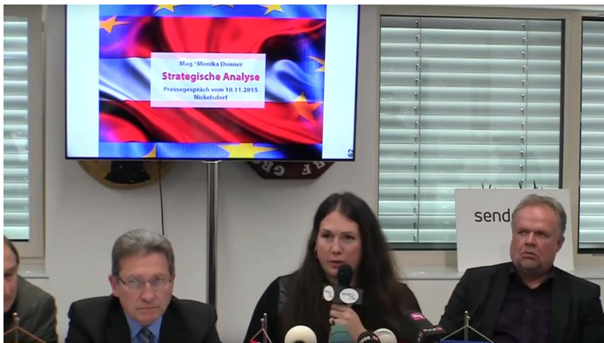
Pressegespräch in Nickelsdorf vom 10. 11. 2015